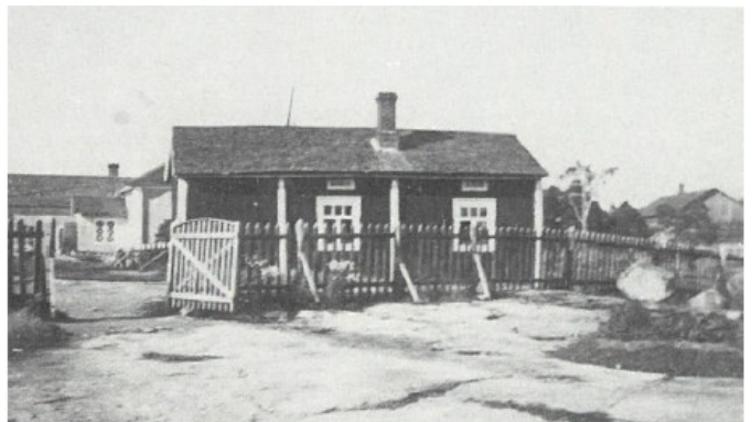
Pitäjäntuvalla eli Kuntalassa sijaitsi Kivimaan lainakirjasto 1800-luvun loppupuolella. Kuva kirjasta Kustavin Maamiesseuran 100-vuotisjulkaisu.

Tältä ajalta ei ole kerätty tilastoja, mutta kirjaston nimelistakirjan mukaan voi arvioida, että 1800-luvun lopulla kirjastossa on ollut kirjoja 100 ja 300 kappaleen välillä. Nidemäärältään Kivimaan laina-kirjasto edusti 1800- ja 1900-lukujen taitteessa hyvin tyypillistä maaseudun kirjastoa, jossa yleensä oli noin 200 kirjaa. Lainauksia Kivimaalla tehtiin joitakin kymmeniä vuosittain. Nimilista-kirjaan on merkitty tieto ” lainataan wiikoksi ”, joten melko lyhyessä ajassa oli kirjat luettava.